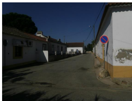
Figura 8 – Arruamentos com perfis transversais estreitos, com passeios reduzidos e estacionamento efectuado ao longo da via, Rua Joaquim Piedade da Silva.