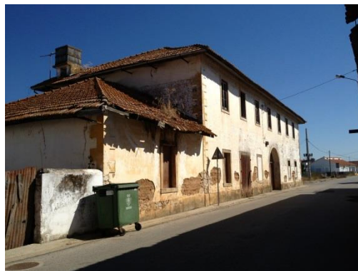
Figura 2 – Edifício em mau estado de conservação, Antiga Adega - Junta de Freguesia do Pombalinho