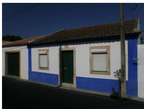
Figura 4 – Edifício com tipologia de fachada característica de Pombalinho