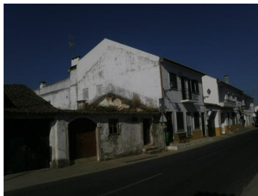
Figura 6 – Arruamentos ladeados por edifícios em degradação