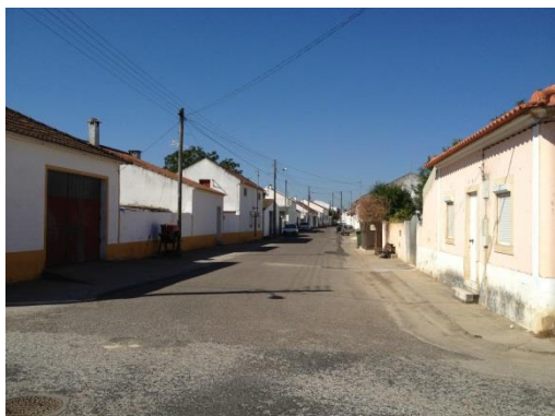
Figura 5 – Arruamentos constituídos sobretudo por edifícios de 1 piso