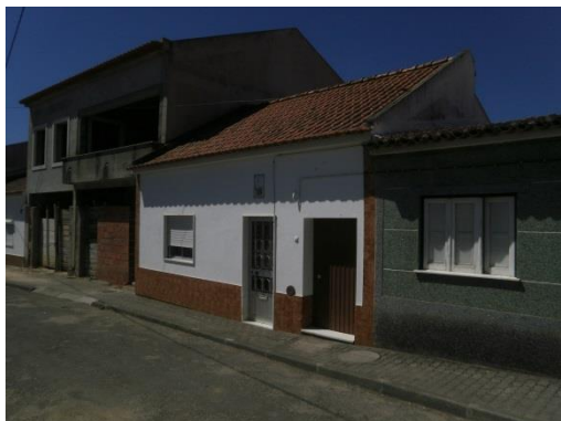
Figura 1 – Utilização de materiais de revestimento dissonantes