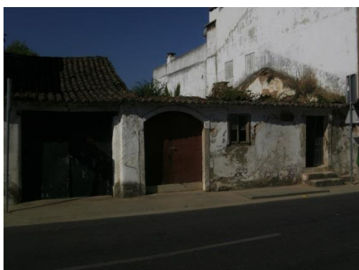
Figura 3 – Edifícios em mau estado de conservação