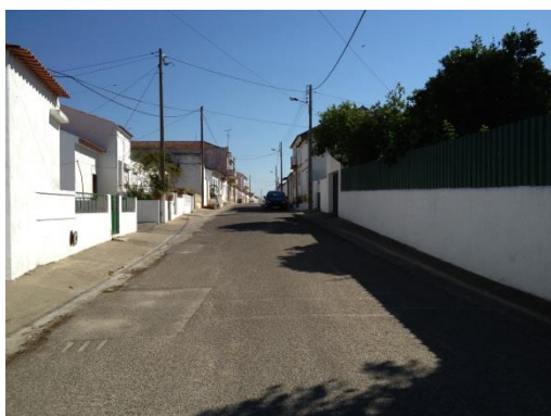
Figura 7 – Largura dos passeios insuficiente, Rua 1º de Dezembro. Arruamento com aspecto espacial e visual pouco atractivo.