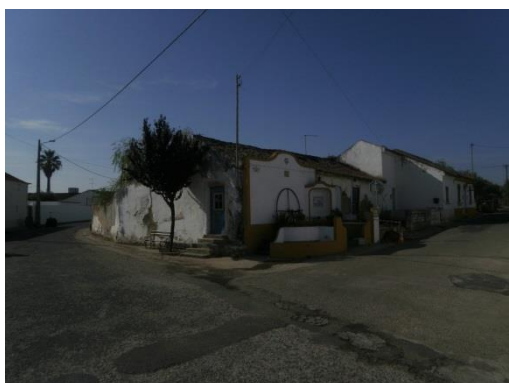
Figura 9 – Espaços públicos sem condições para potenciar a permanência da população, Largo entre a Rua de Santo António e a Rua Joaquim Gonçalves Ferreira.