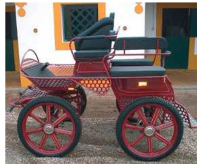
Tipo de carro interdito no Largo da Feira nos dias 8,9, 10 e 11